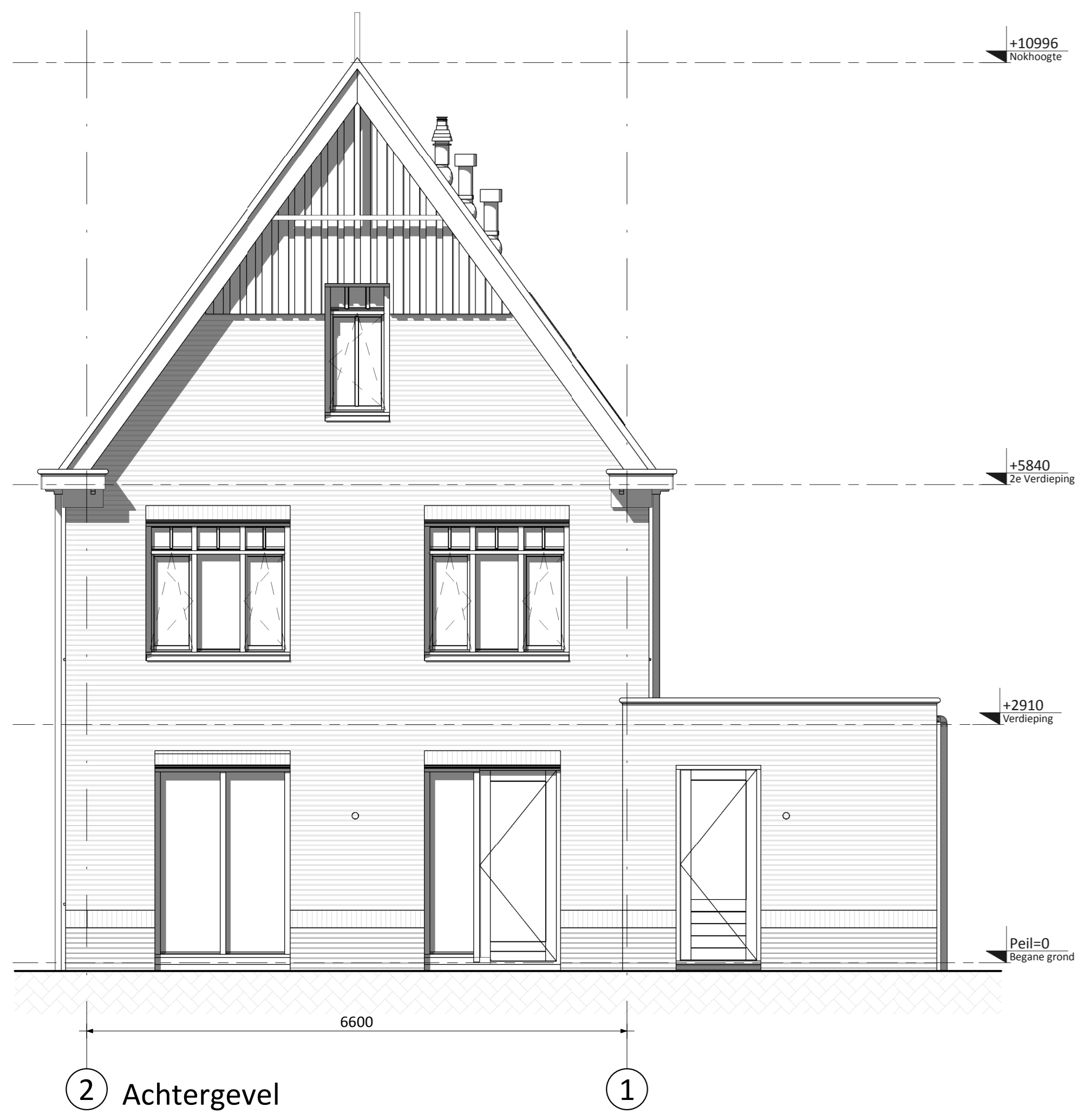
2 Achtergevel 1