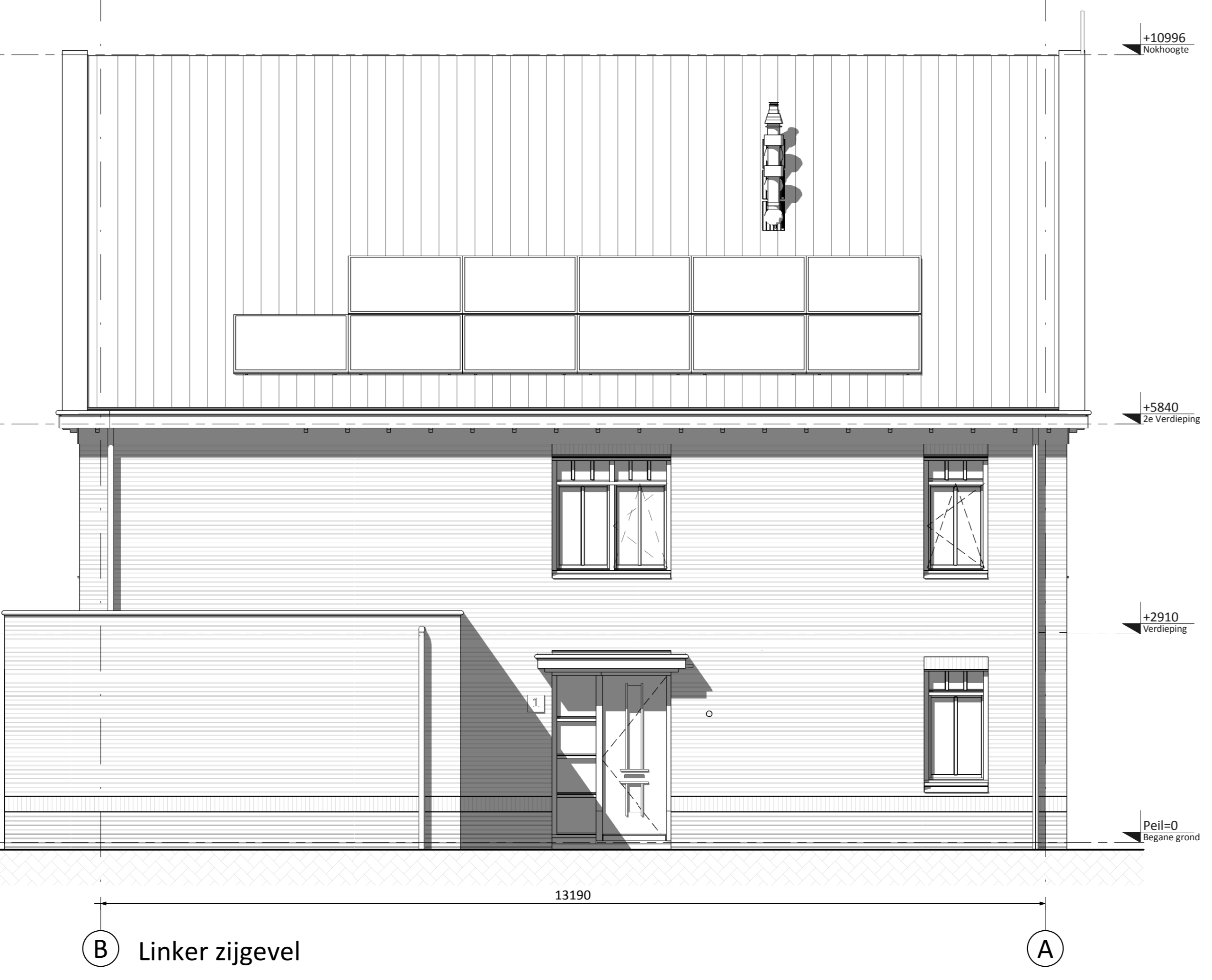
B linker zijgevel A