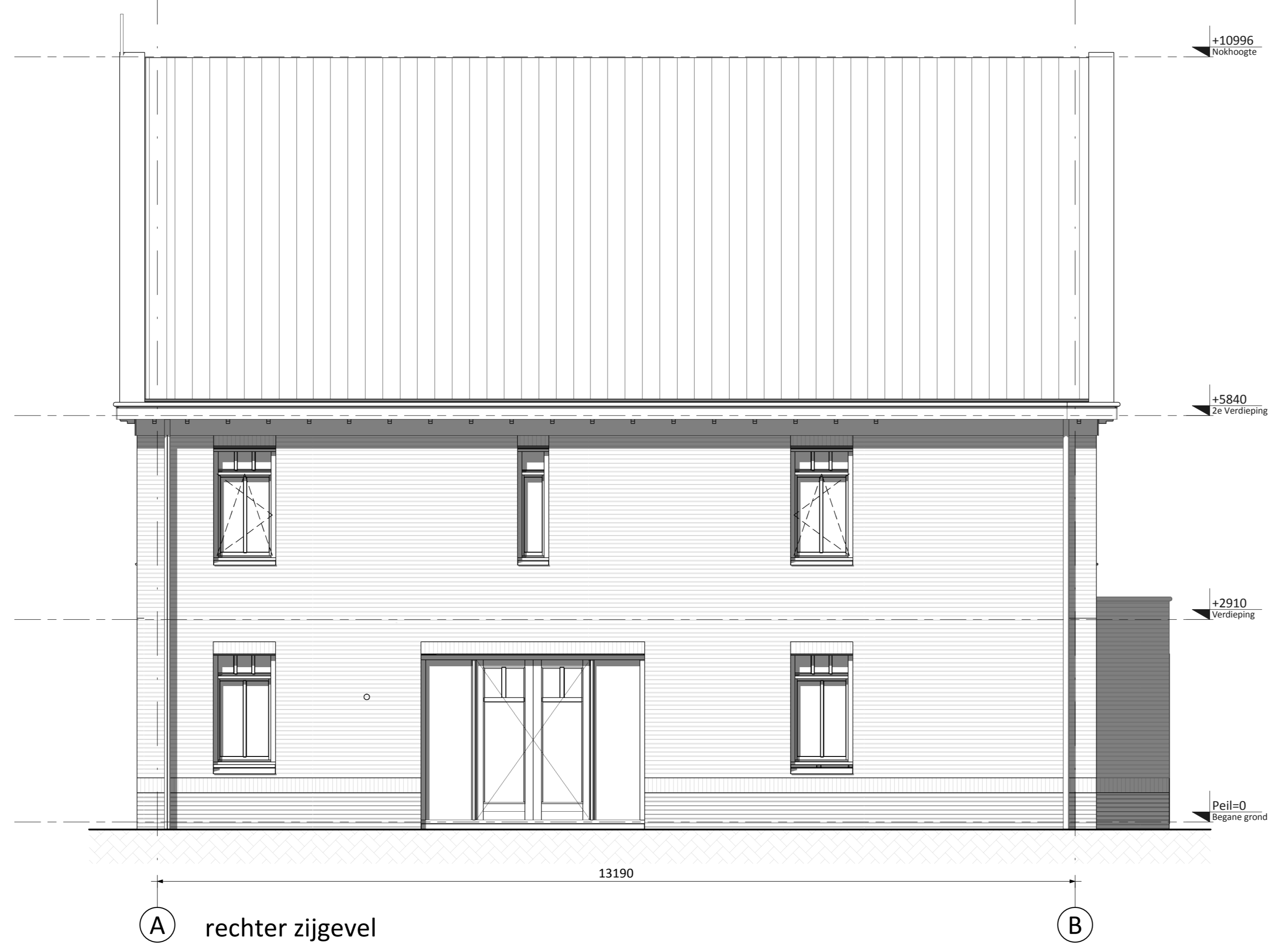
A rechter zijgevel B