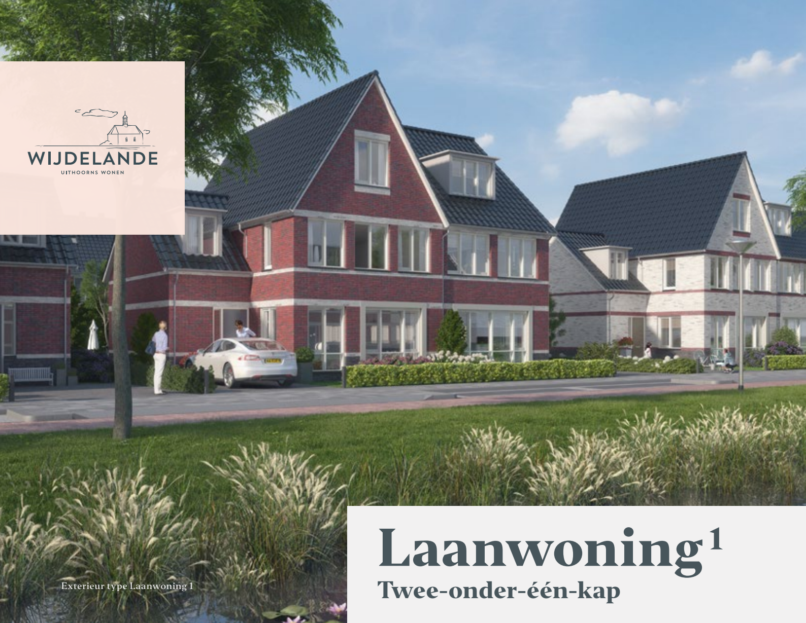
Exterieur type Laanwoning 1