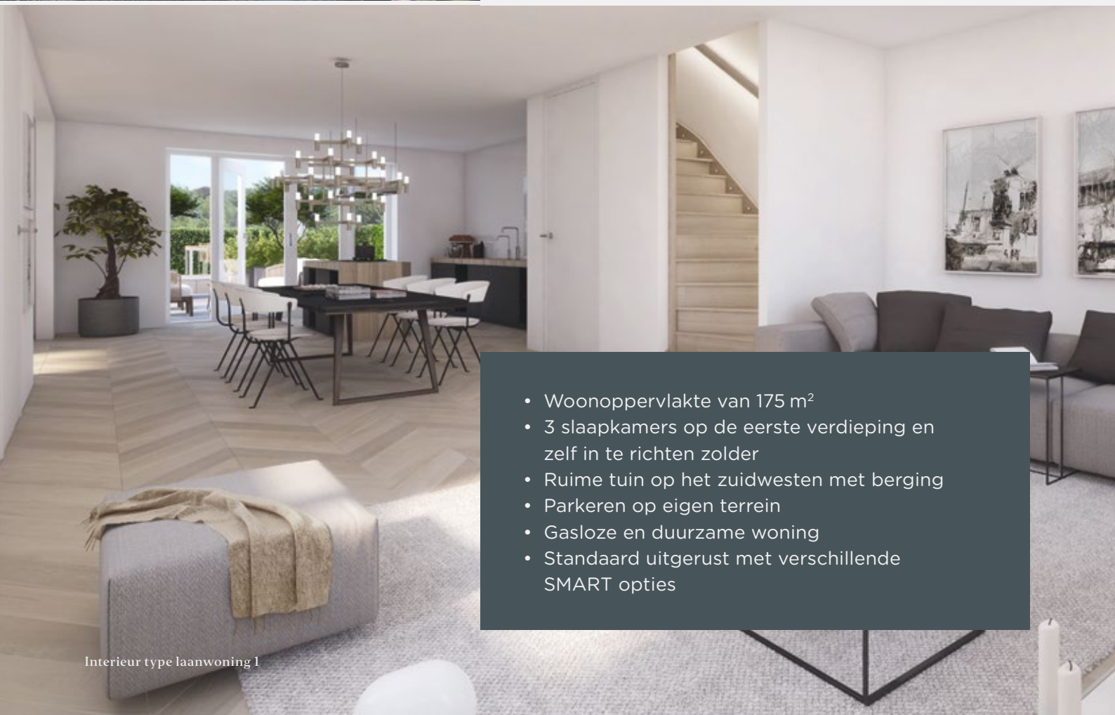
Interieur type laanwoning 1