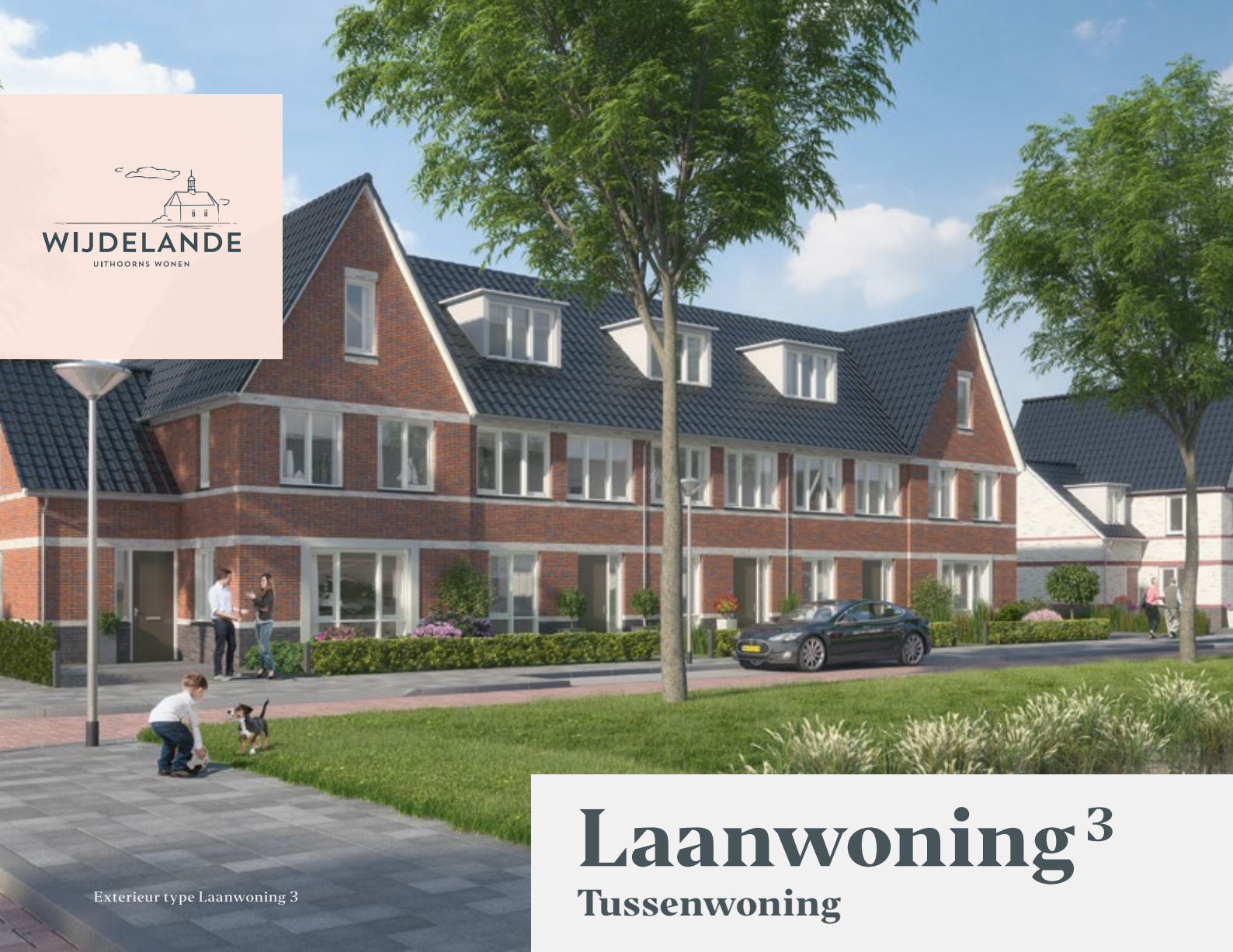
Exterieur type Laanwoning 3