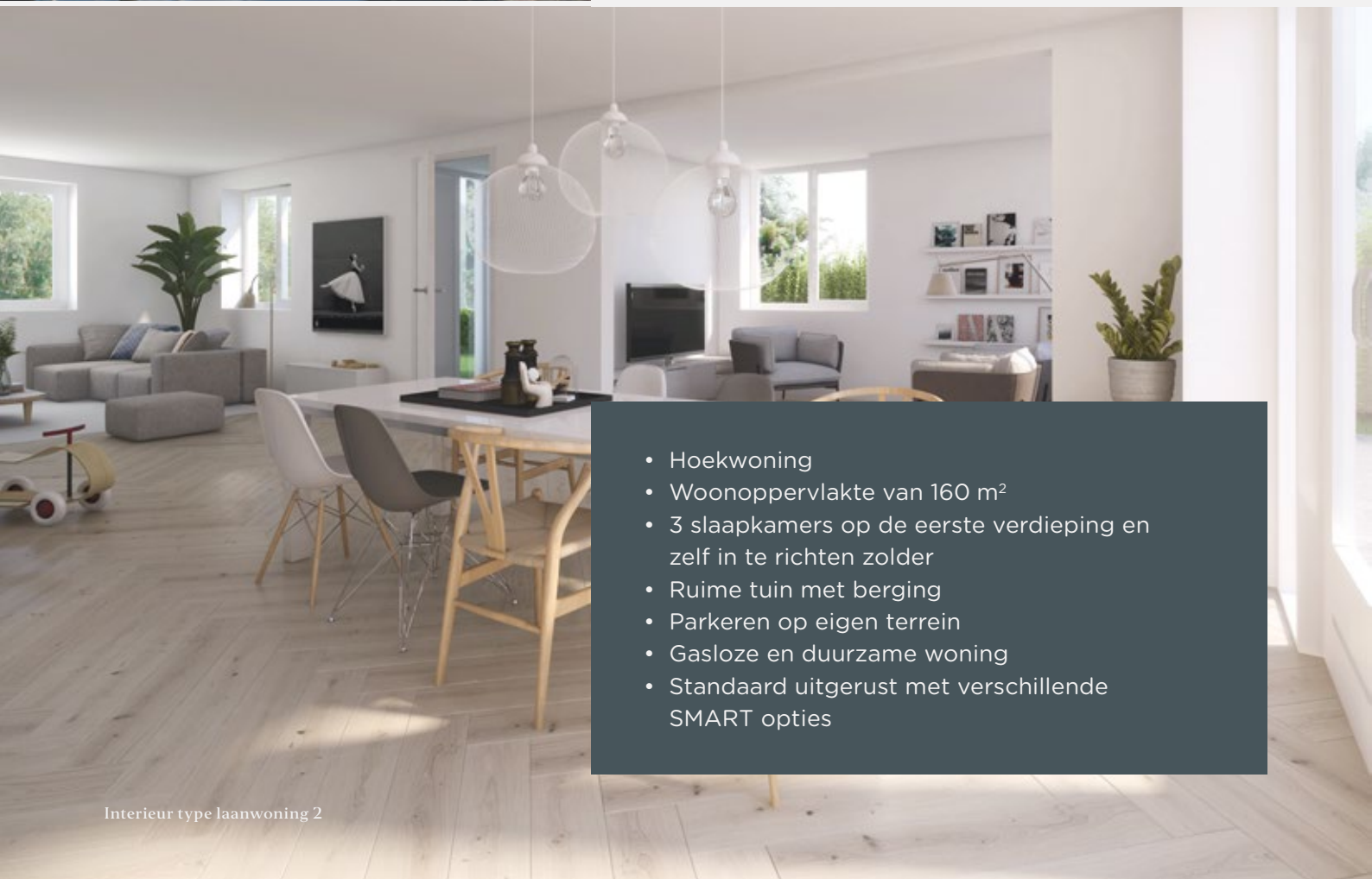
Interieur type laanwoning 2