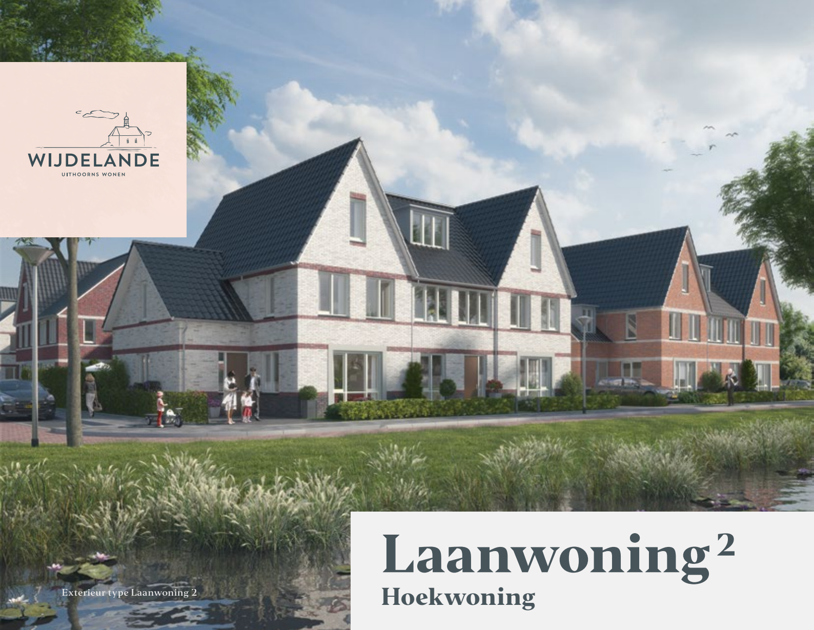
Exterieur type Laanwoning 2