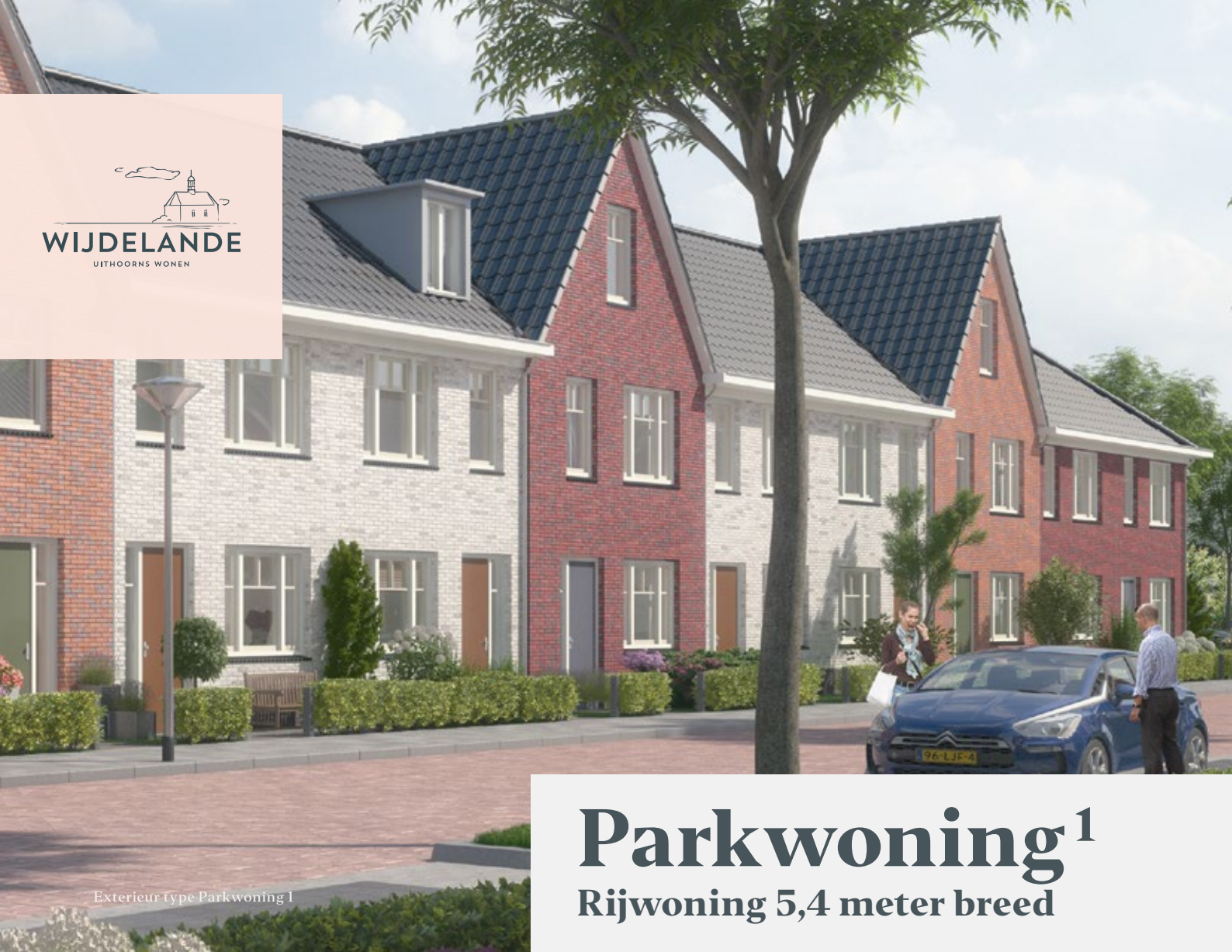
Exterieur type Parkwoning 1