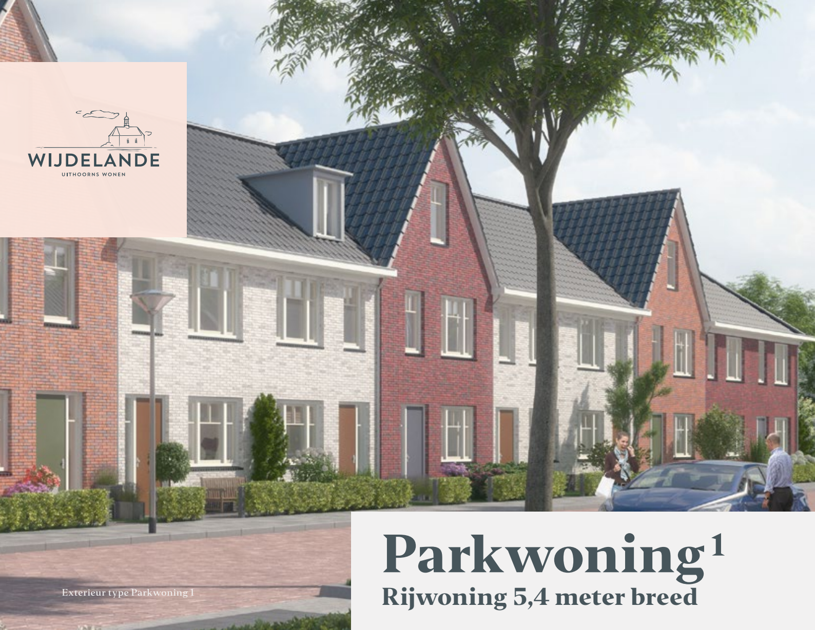
Exterieur type Parkwoning 1