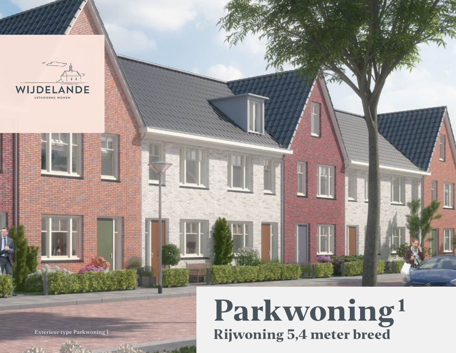
Exterieur type Parkwoning 1