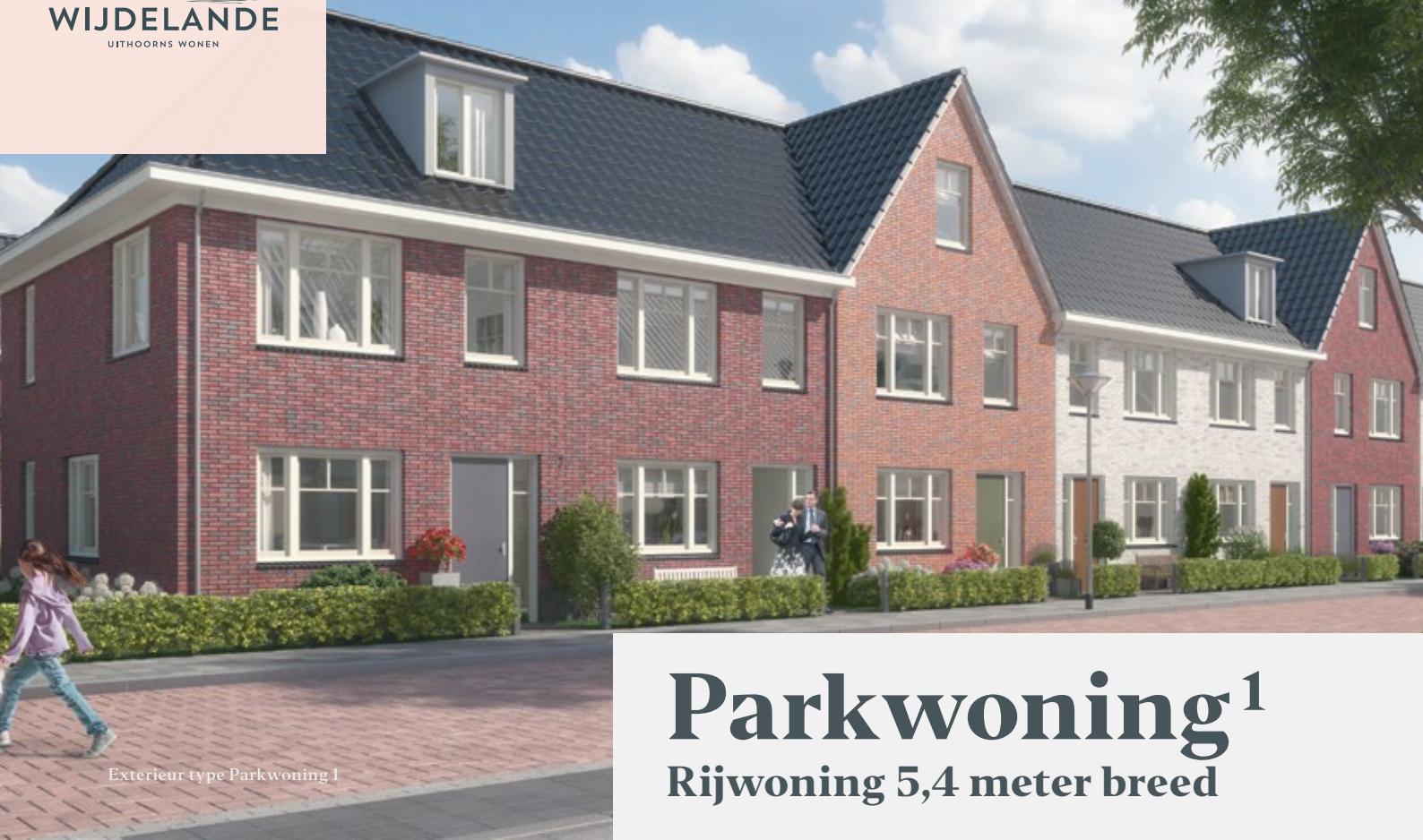
Exterieur type Parkwoning 1