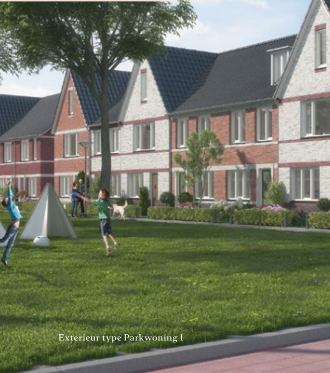
Exterieur type Parkwoning 1