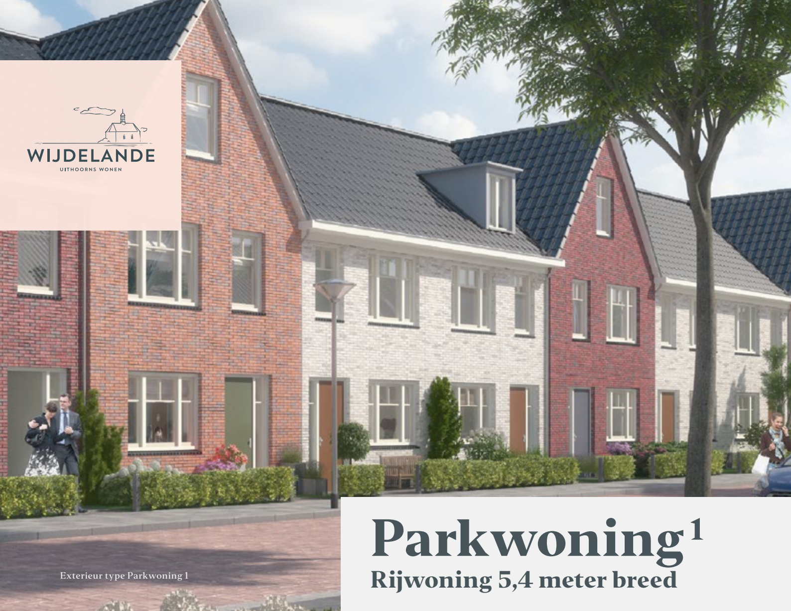
Exterieur type Parkwoning 1