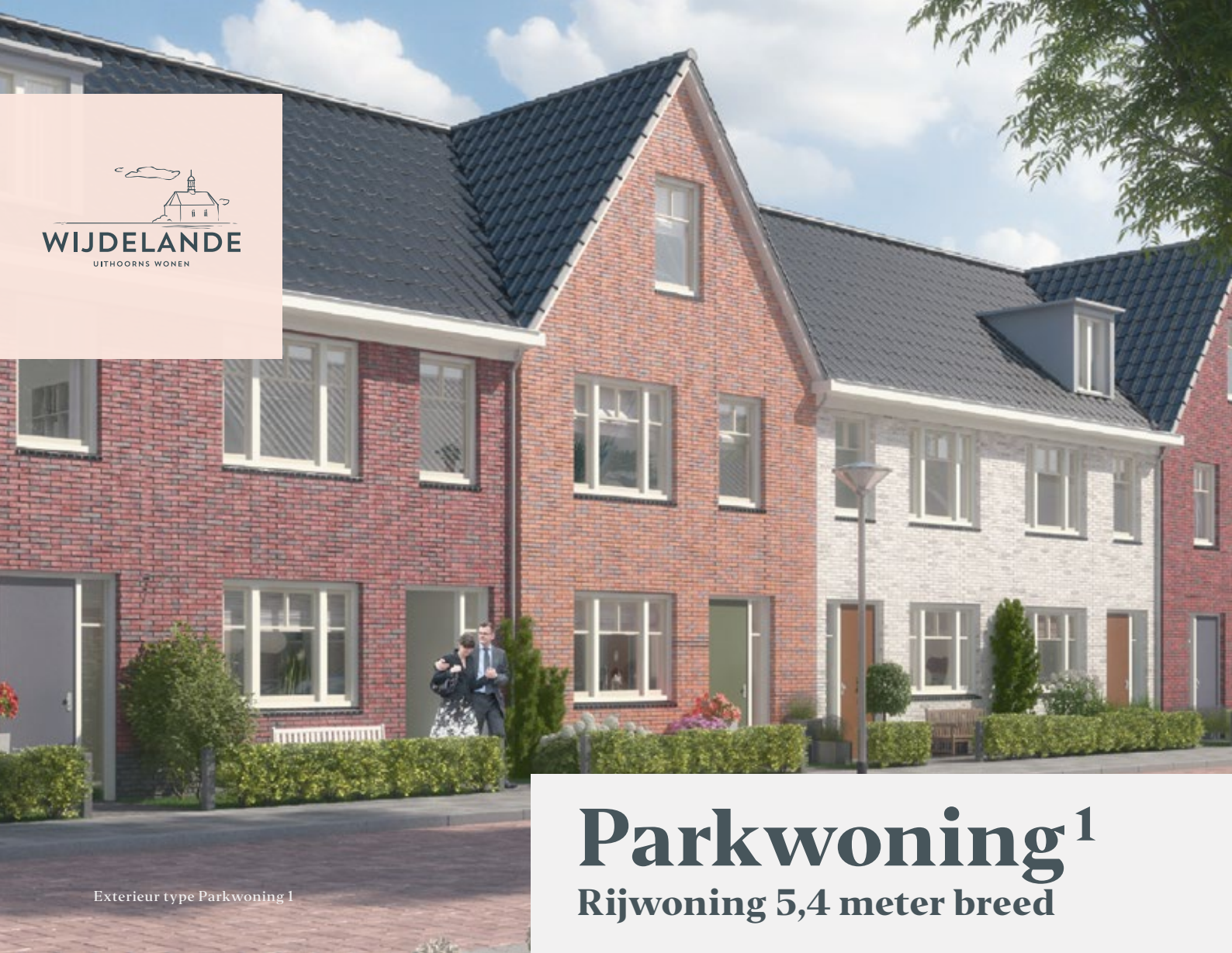
Exterieur type Parkwoning 1