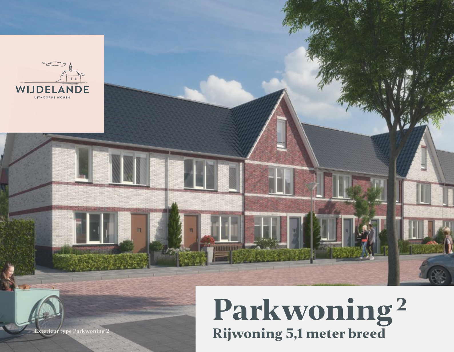
Exterieur type Parkwoning 2