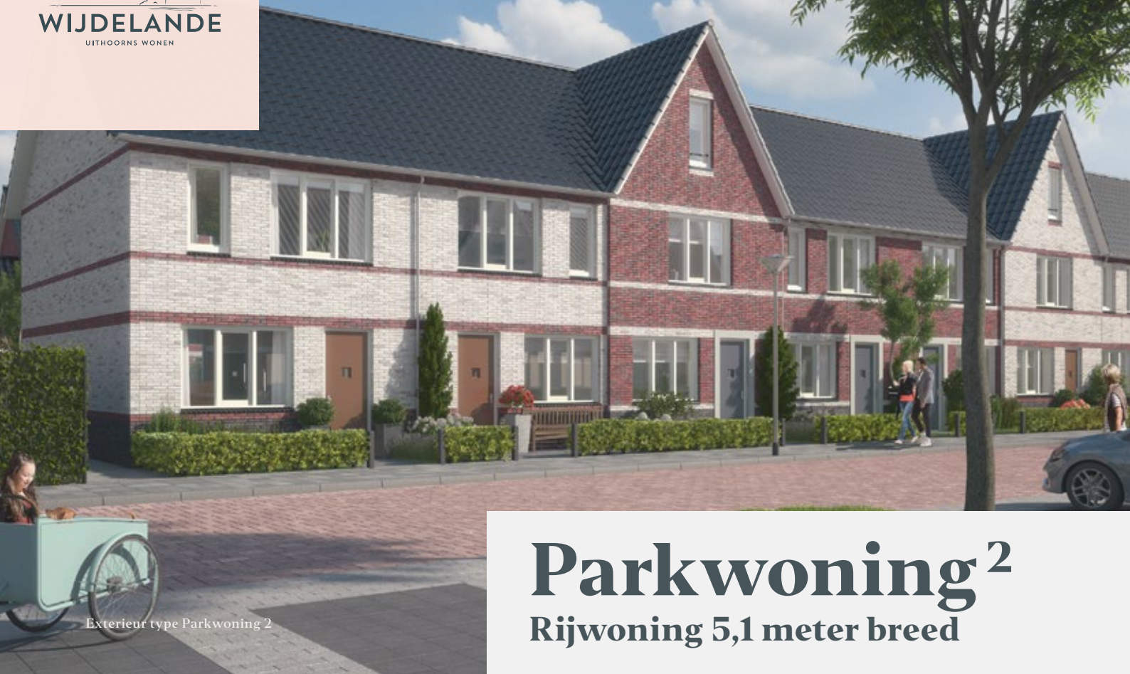
Exterieur type Parkwoning 2