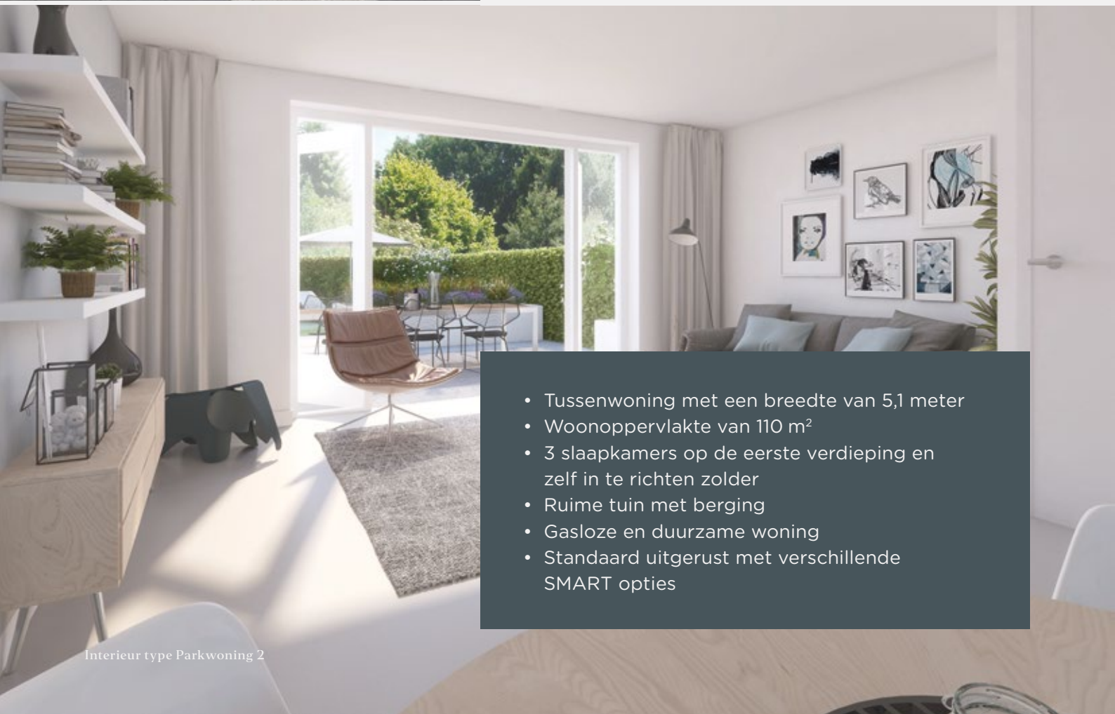
Interieur type Parkwoning 2