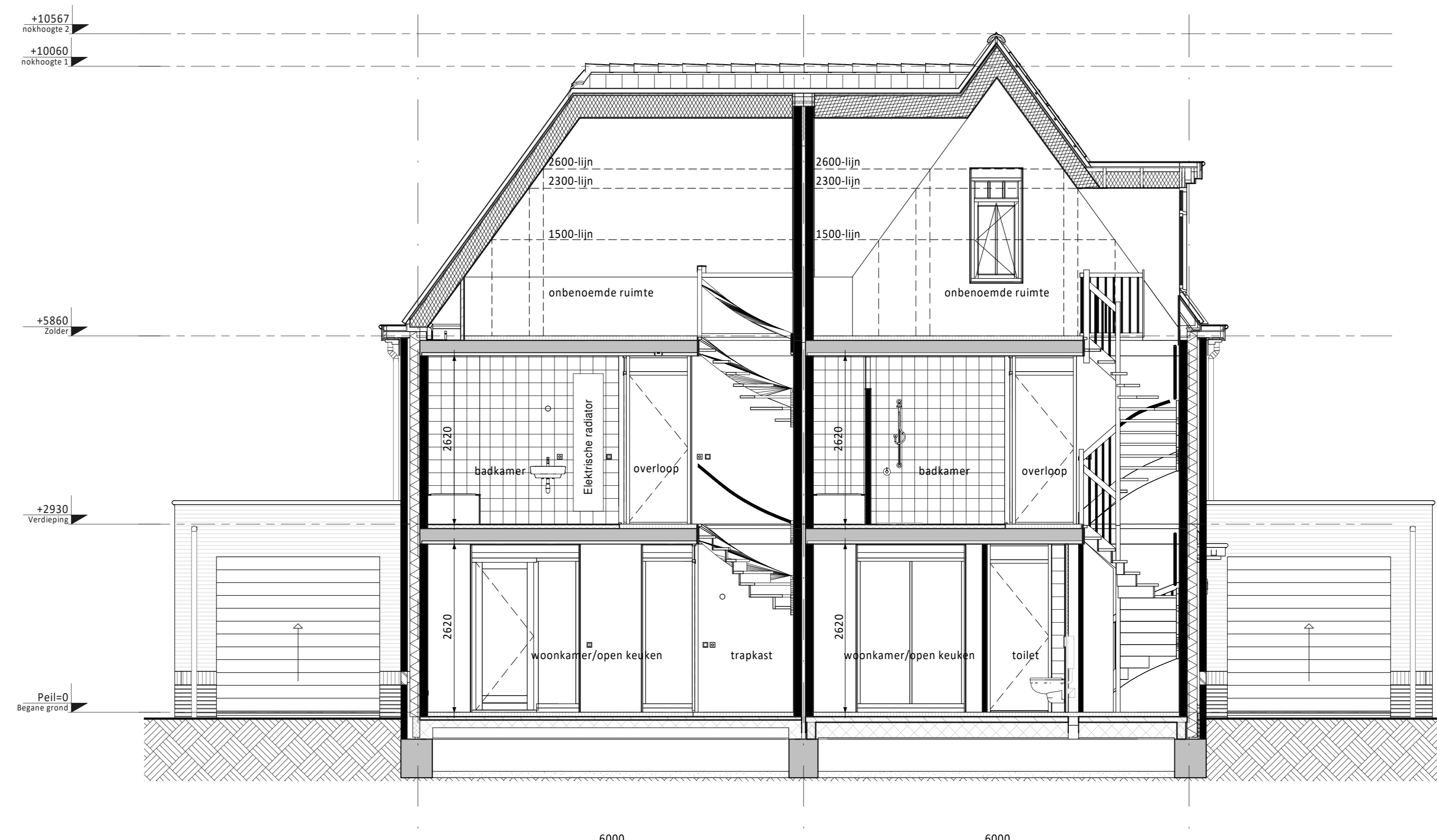
Doorsnede A ① Bouwnummer 29 ② Bouwnummer 30 ③