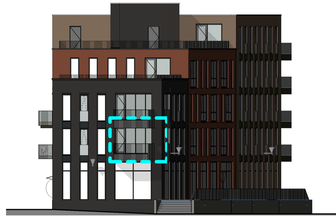
1:200 gevelaanzicht Oost