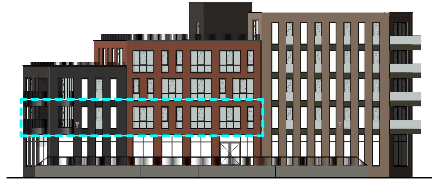
1:200 gevelaanzicht Noord