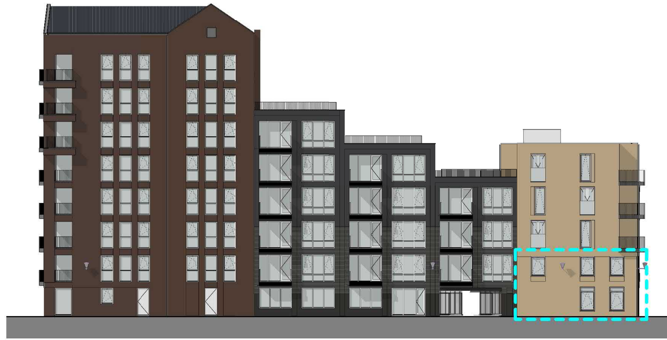
1:200 ZIJGEVEL (WEST)