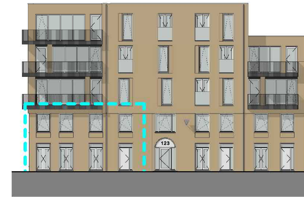
1:200 VOORGEVEL (ZUID)