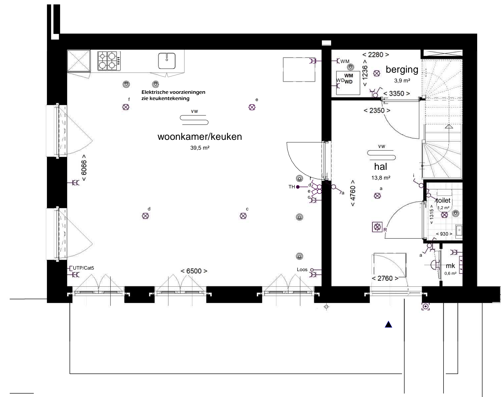
1:50 BEGANE GROND