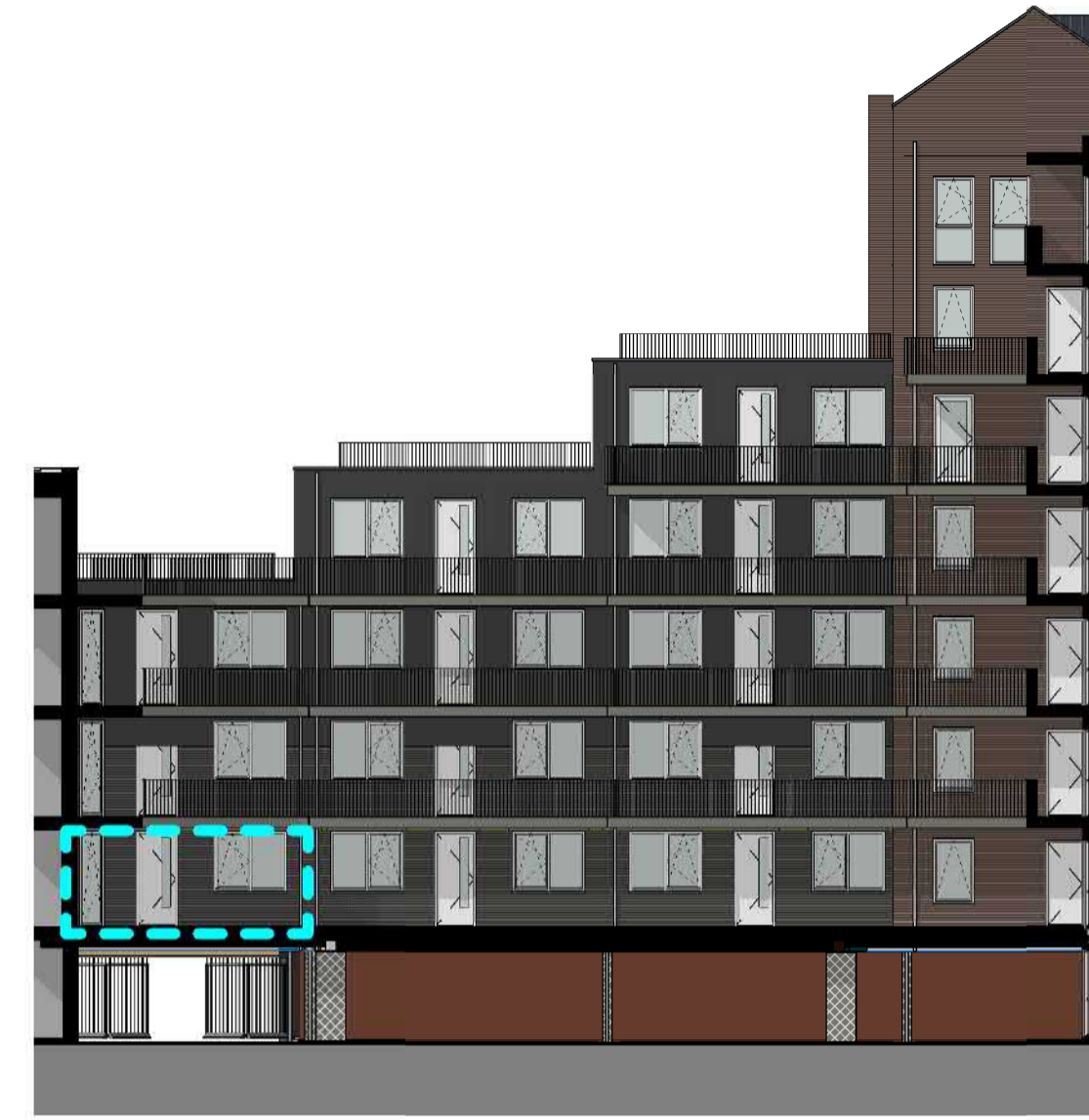
1: 200 ACHTERGEVEL (OOST)