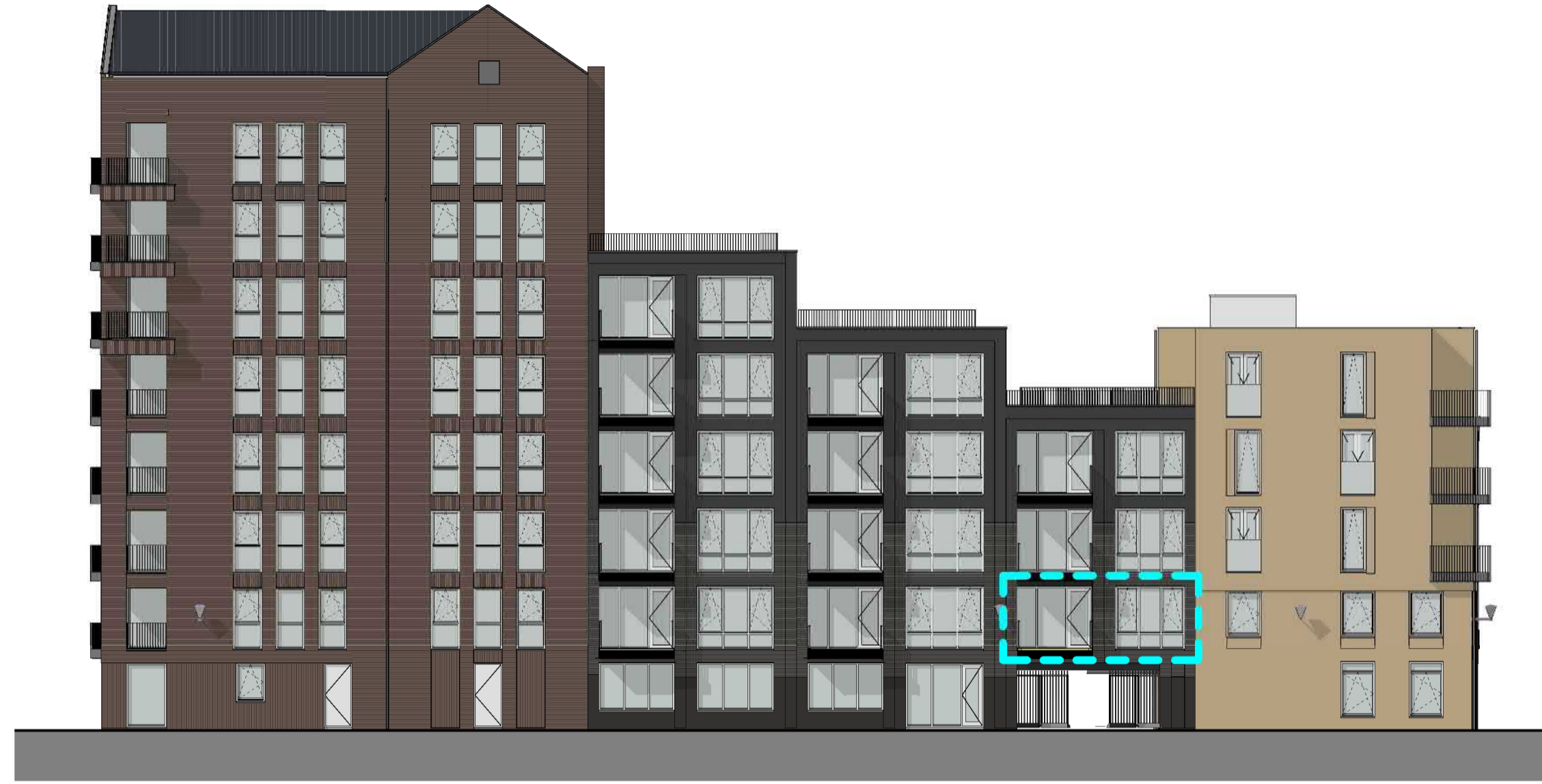
1: 200 VOORGEVEL (WEST)