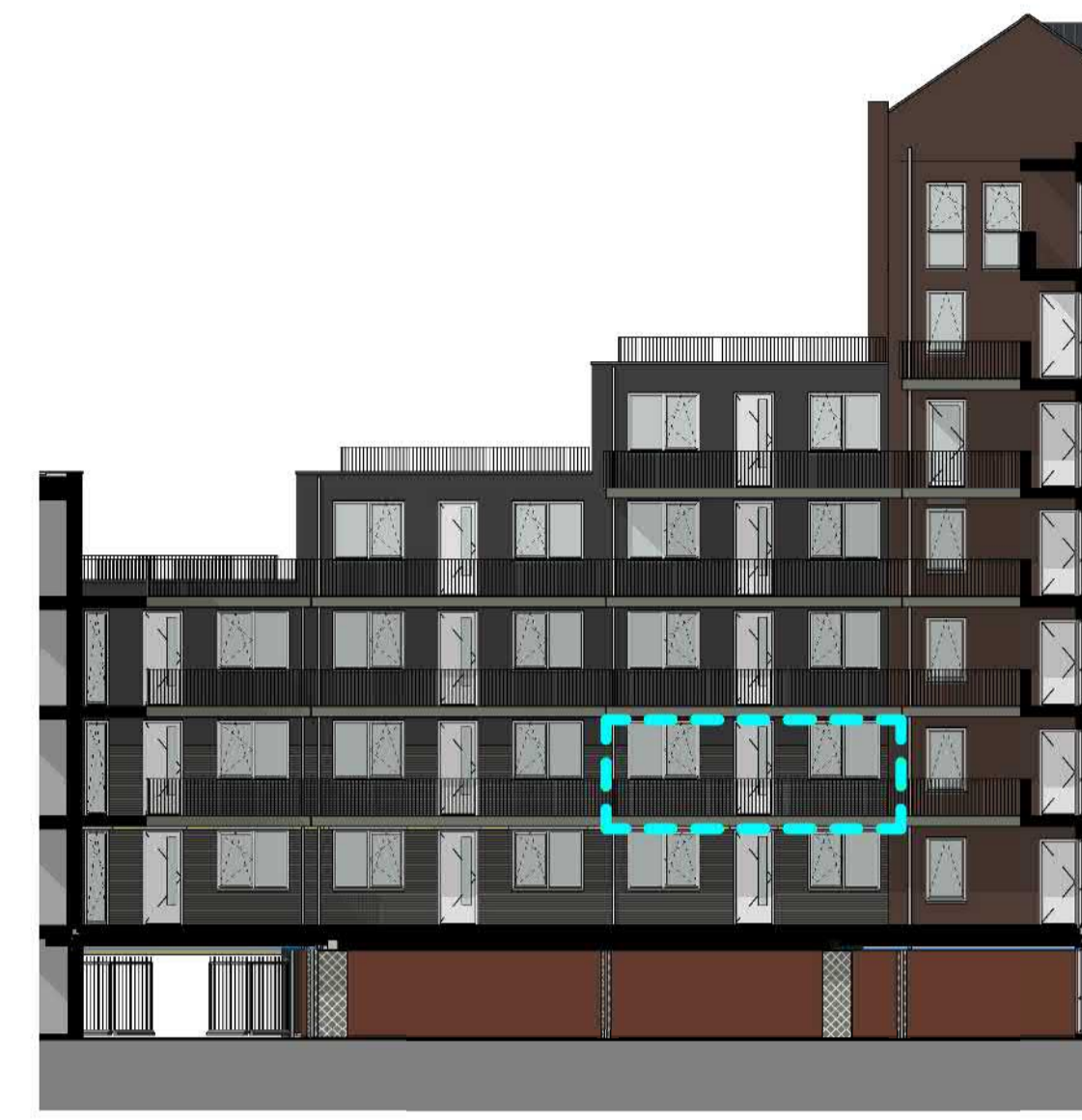
1 : 200 ACHTERGEVEL (OOST)