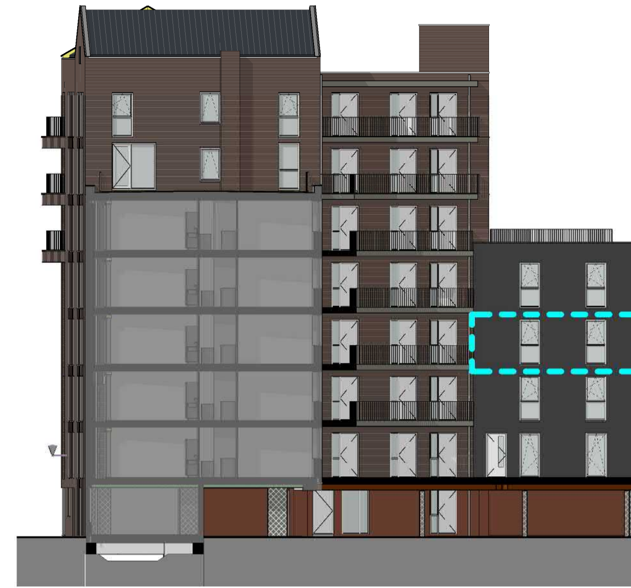
1:200 ACHTERGEVEL (ZUID)