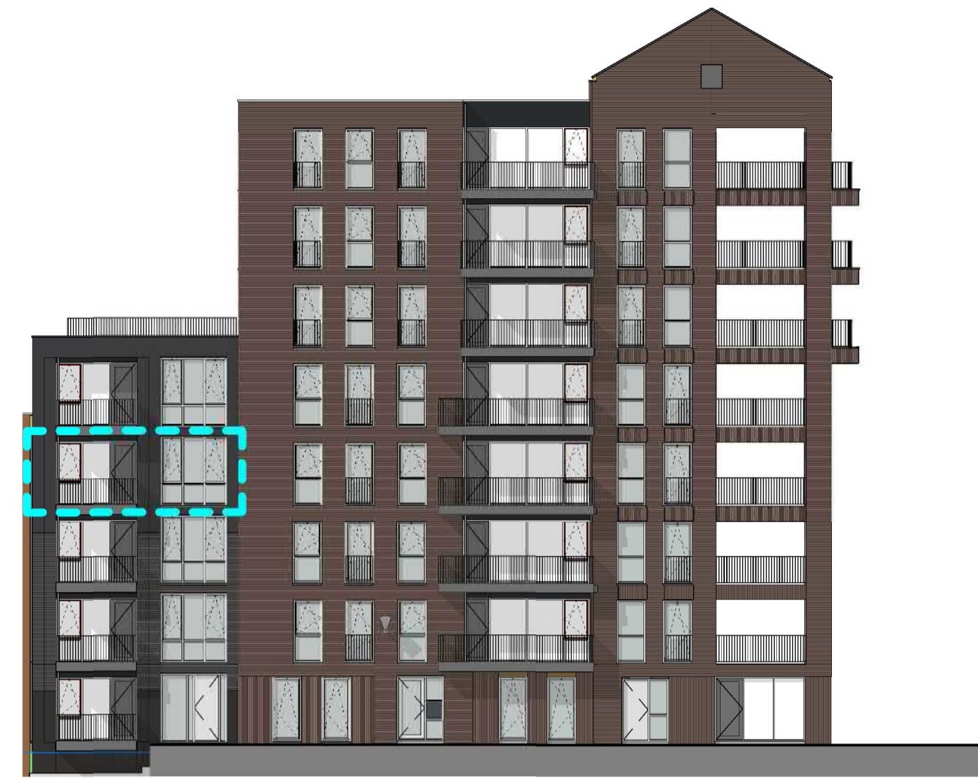
1:200 VOORGEVEL (NOORD)