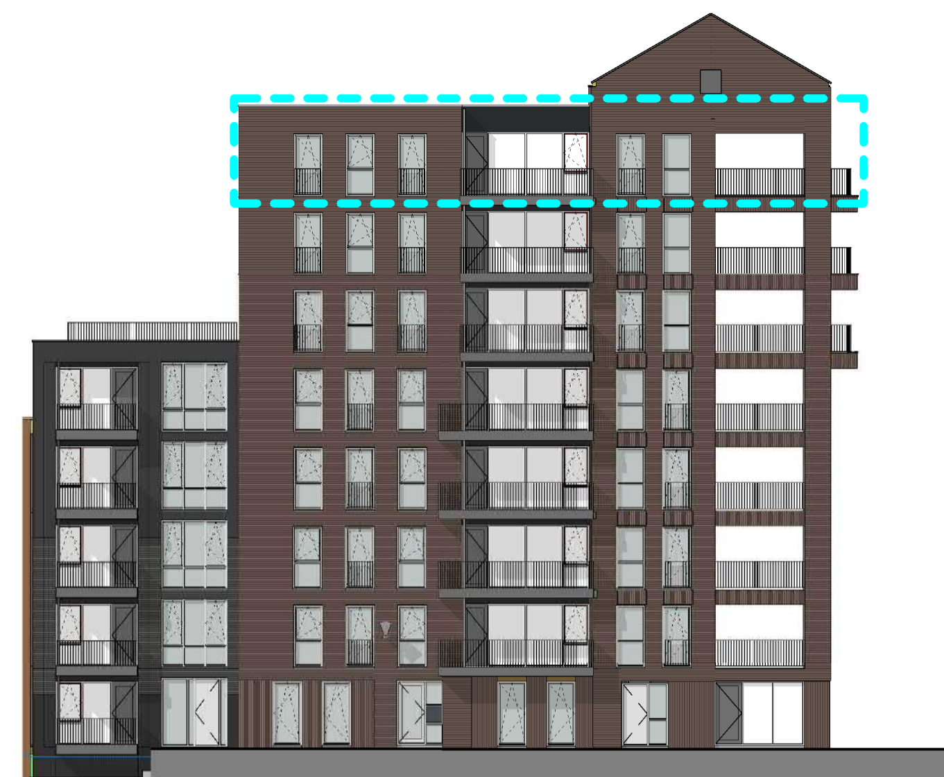
1:200 VOORGEVEL (NOORD)