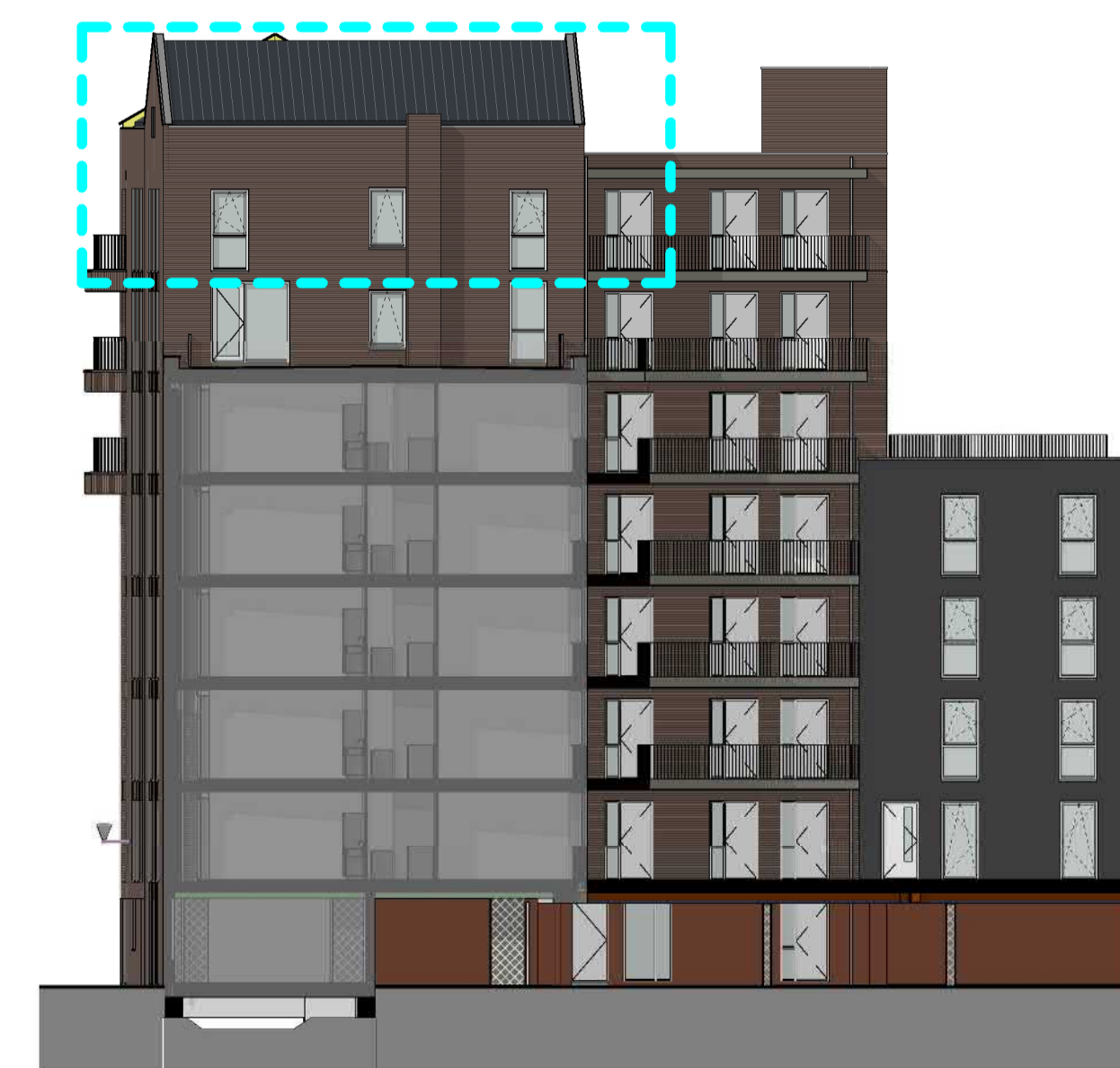
1:200 ACHTERGEVEL (ZUID)