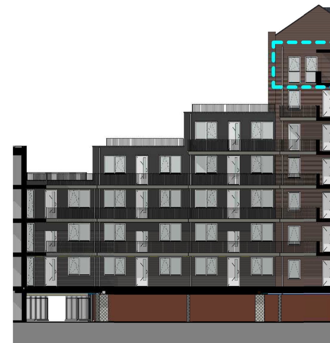
1:200 ZIJGEVEL (OOST)