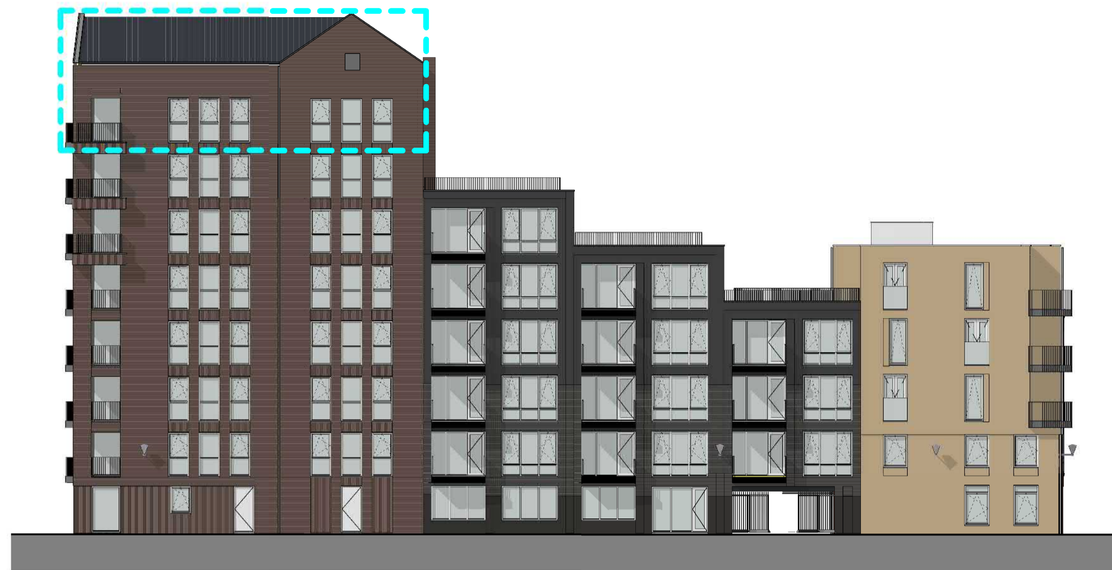
1:200 ZIJGEVEL (WEST)